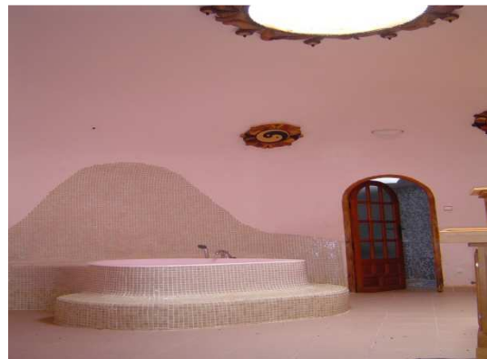
La Paridera. Primera casa de partos que construimos. La tierra como útero.

La Paridera, The first birthing house we built. The earth as a uterus.