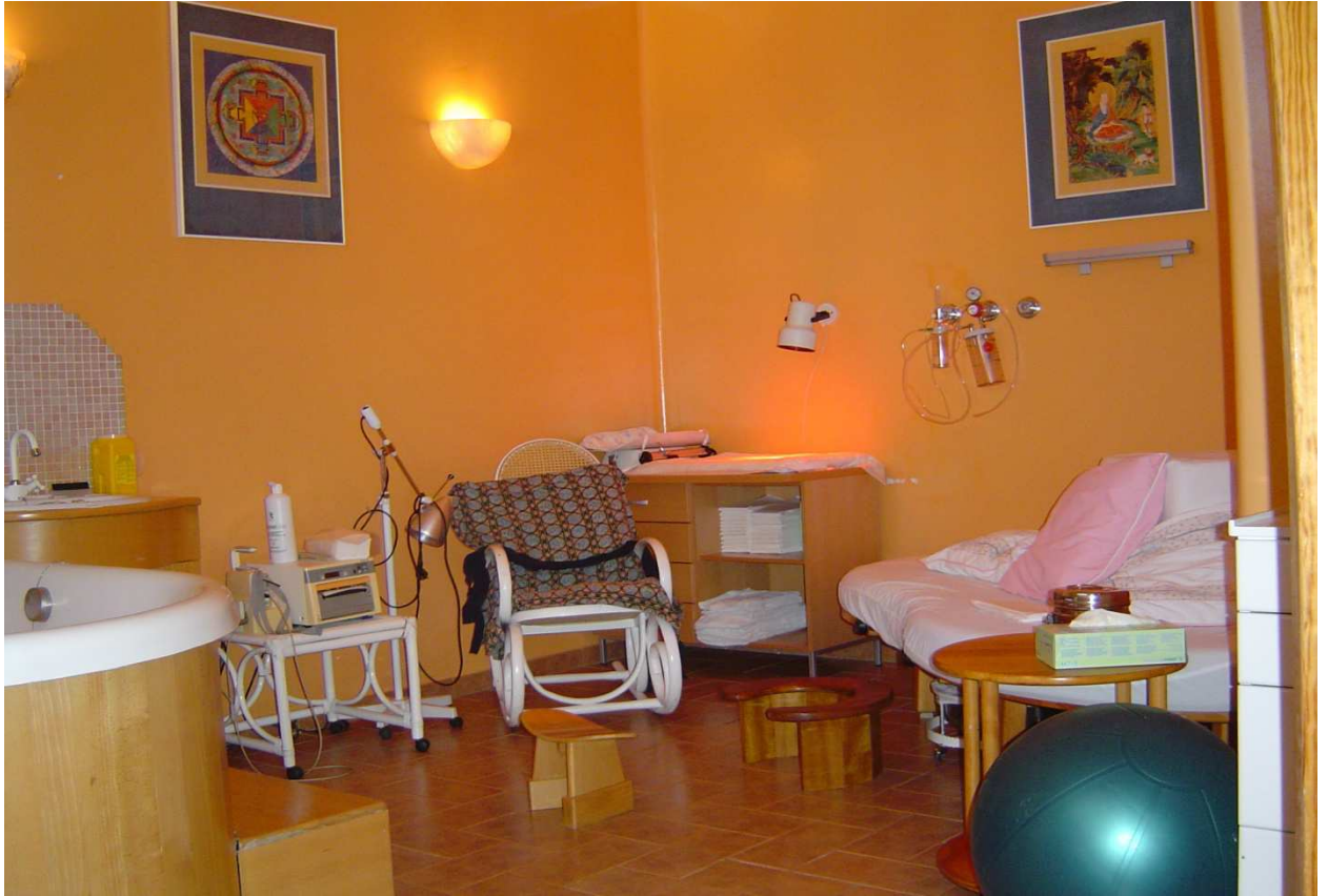
Sala de partos de la Maternidad. Bañera de dilatación. Había otra sala de partos, similar. Maternity delivery room. Birth pool. There was another delivery room, with similar characteristics.